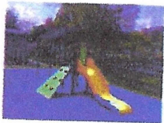
Kabouter Klauter 20, Speeltoestellen/Combinatietoestellen