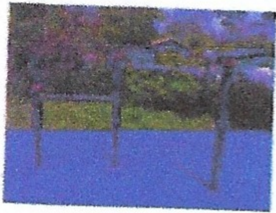
Duikelrek Duo, Speeltoestellen/Behendigheid/Duikelrek - meerdelig