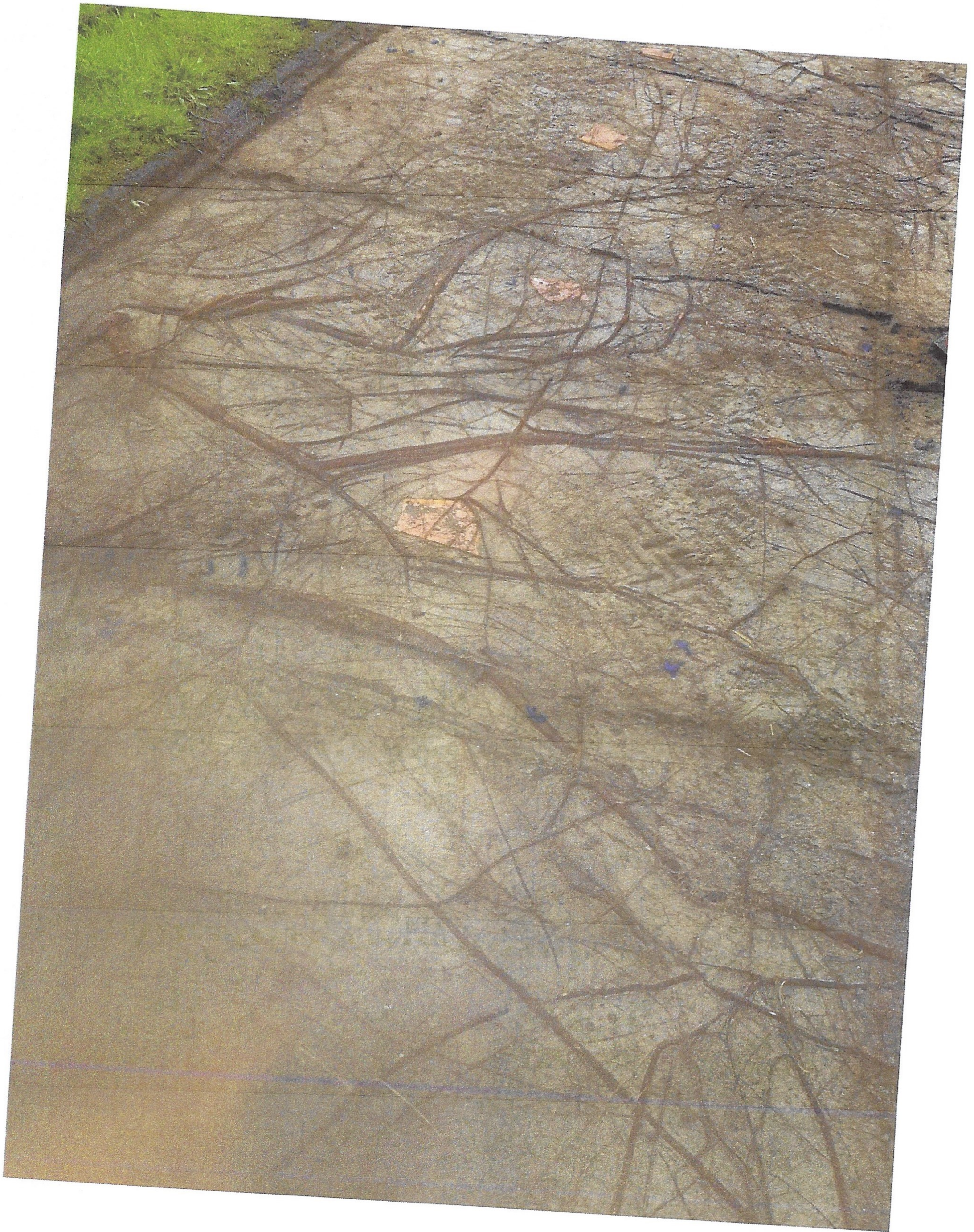
Speelplaats Blekersveld, Overveen